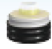
鋼管の中へ GNGWA を挿入。