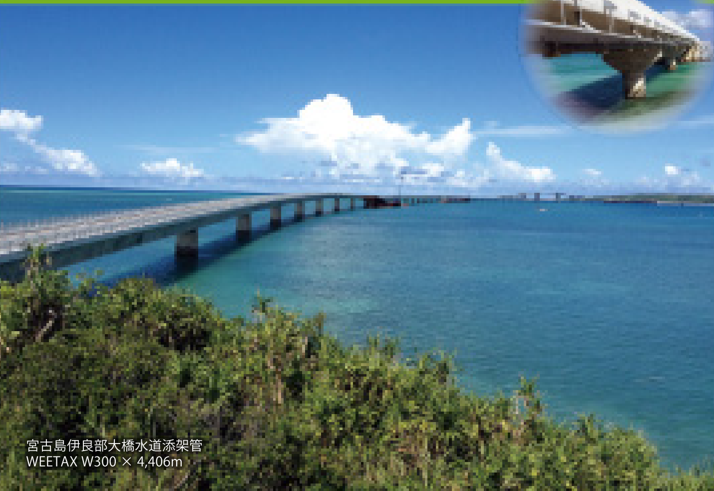
宮古島伊良部大橋水道添架管 WEETAX W300 × 4,406m