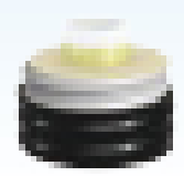
異型管なしでカーブのついた橋に添架できます。