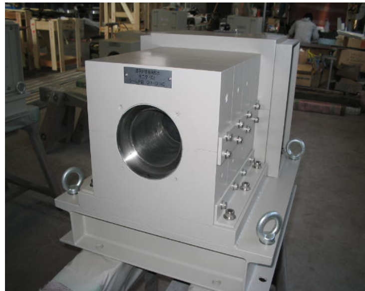
放射線検出器用鉛遮蔽体 (鉛重量約5トン)

MESCO 素材営業部は、今後も多様な遮蔽用途に適用する商品の開発・販売を通じて広く社会に貢献して参ります。