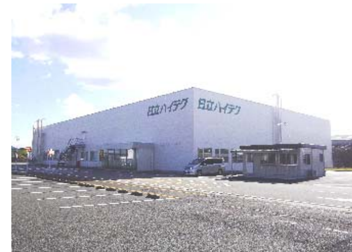
(株) 日立ハイテクノロジーズ殿工場外観