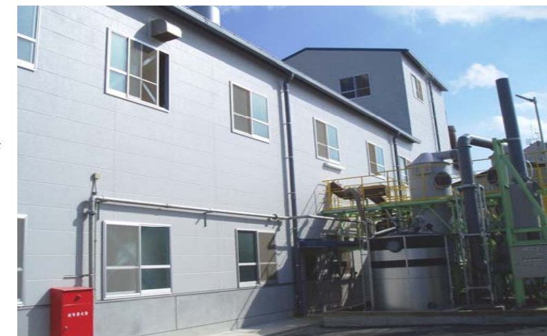
ガラス研磨剤製造プラント

今回の統合を機に MESCO 九州支店は、 MESCO 本社との連携を更に深め、事業の効率化および技術力向上を目指してまいります。