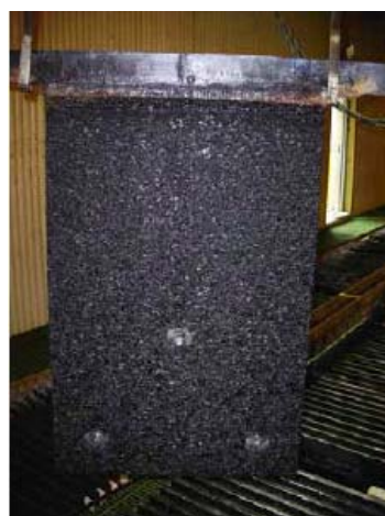
↑使用2.5年後、 均一な腐食層の形成と 安定した寸法のRSR製アノード