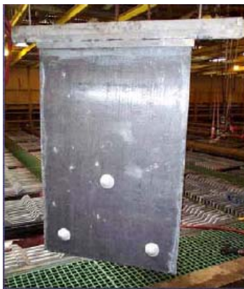
新しい圧延 ↓Pb-Ag-Ca アノード

MESCO は、このテスト結果を生かして、RSR社との技術的信頼関係を更に構築し、日本国内のユーザー様への拡販を進めていきます。