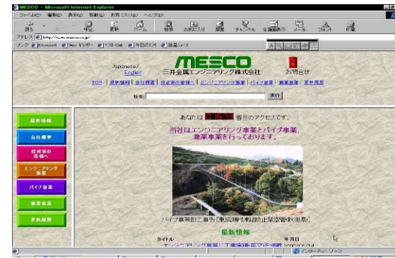
MESCOホームページ表紙