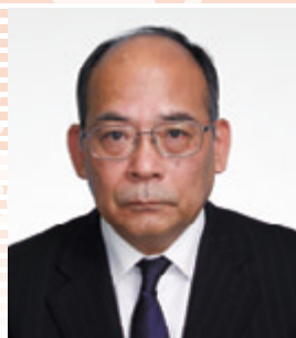
取締役 兼 上席執行役員 パイプ事業部長