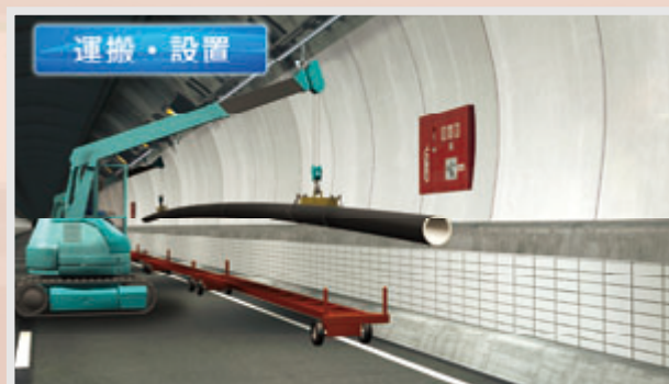
しなやかで可とう性に富み耐震性UP