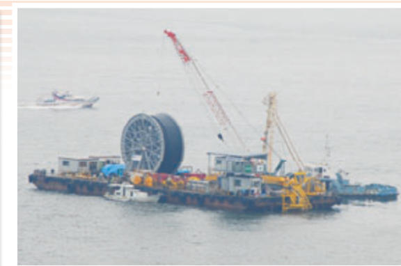
現場での布設状況