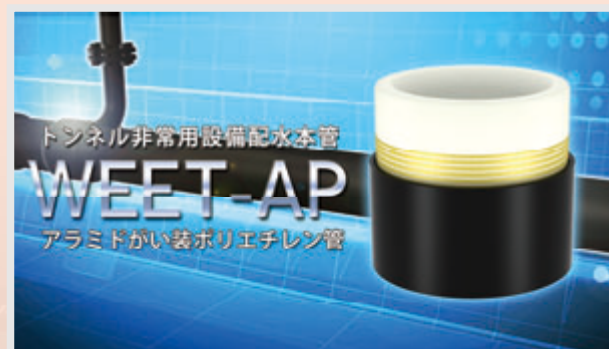
腐食しない三井金属エンジニアリング株の複合ポリエチレン管

財団法人建材試験センターでの耐久試験を行い、埋設環境下においてポリエチレンの軟化温度以下であることを確認しました。