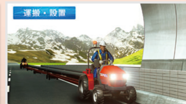
軽量で小型車両でも横持運搬可能