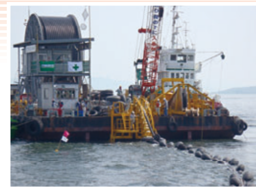
現場での布設状況

当社は40年来、培った海洋事業におけるノウハウを、今後もお客様に提案してまいります。