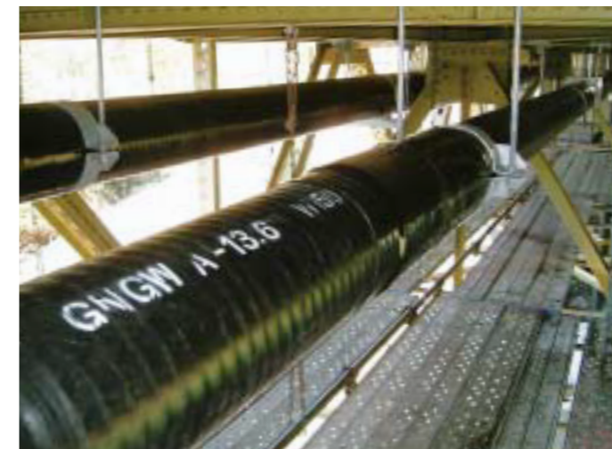
呼び径:W150 長さ:135m 呼び径:W250S 長さ:137.5m

上水道管の老朽化による改修工事に、MESCOの凍結防止管GNGWAが採用されました。優れた断熱性能に加えて、信頼性の高いバット融着継手とEF継手による管と継手の一体化構造、高密度ポリエチレン管特有の耐震性や耐久性を生かして地域の皆様のライフラインとして貢献します。